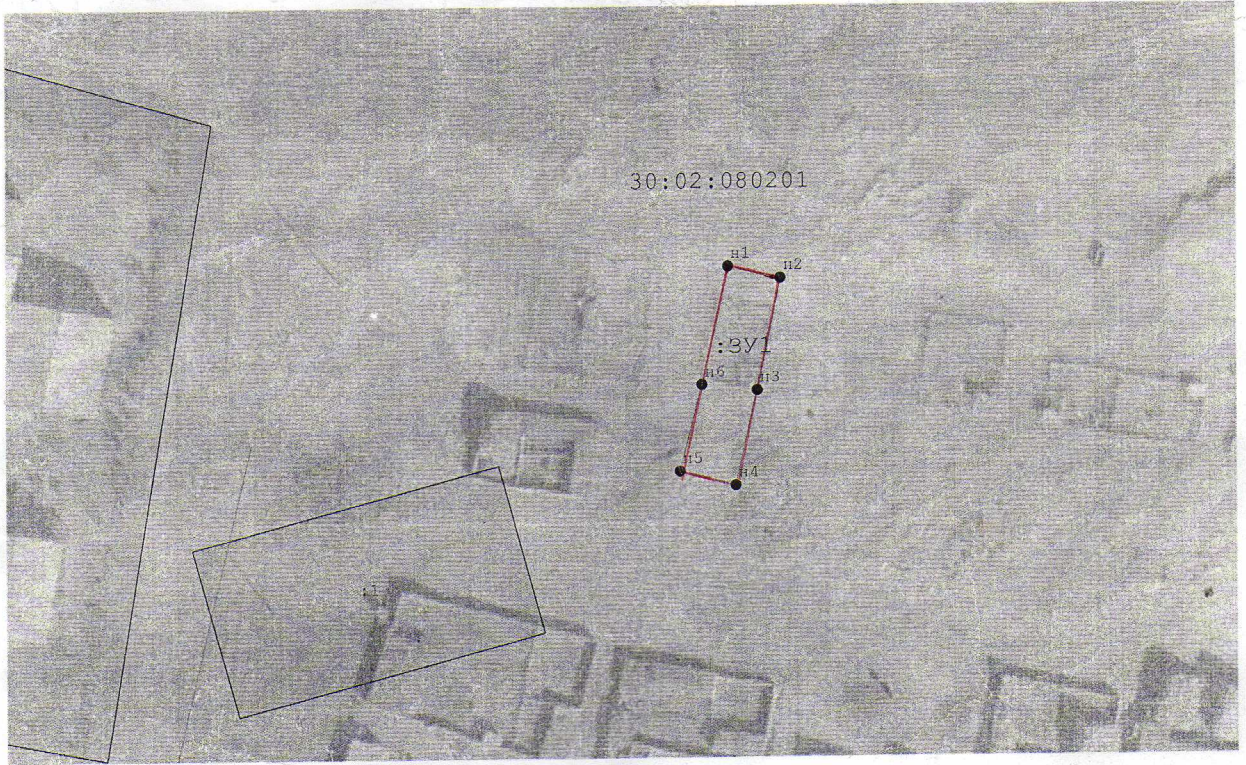
Схема расположения земельного участка